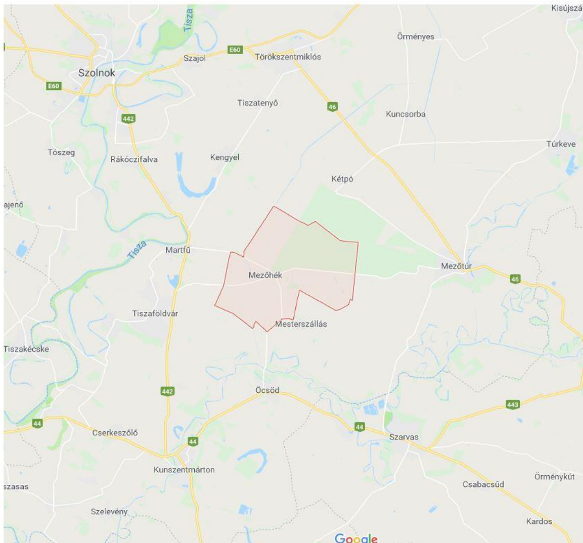
Elhelyezkedése térkép